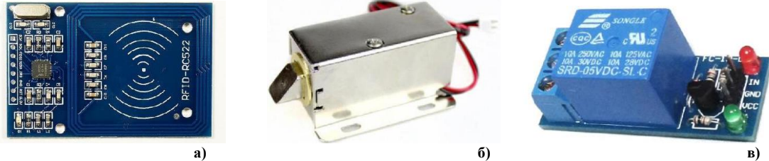
Рис. 2. Складові елементи СКУД: а – зчитувач RFID-RC522, б – електромагнітний замок, в – модуль електромеханічного реле зі світлодіодами

засувки та механізми приводу воріт або поворотної платформи, залежно від місця розташування системи на підприємстві. У даній СКУД електромагнітні замки обрані так, що система встановлюється для контролю доступу в приміщення через двері (рис 2.б.). В системі також необхідні елементи індикації для відображення статусу про надання доступу або його відмови. До таких відносяться світлодіоди та звуковипромінювачі (зумери) (рис. 2.в). Для зберігання бази ID-кодів використовується зовнішня пам'ять, а саме картка microSD з адаптером. Для взаємодії контролера з microSD картою визначено модуль SD Card.